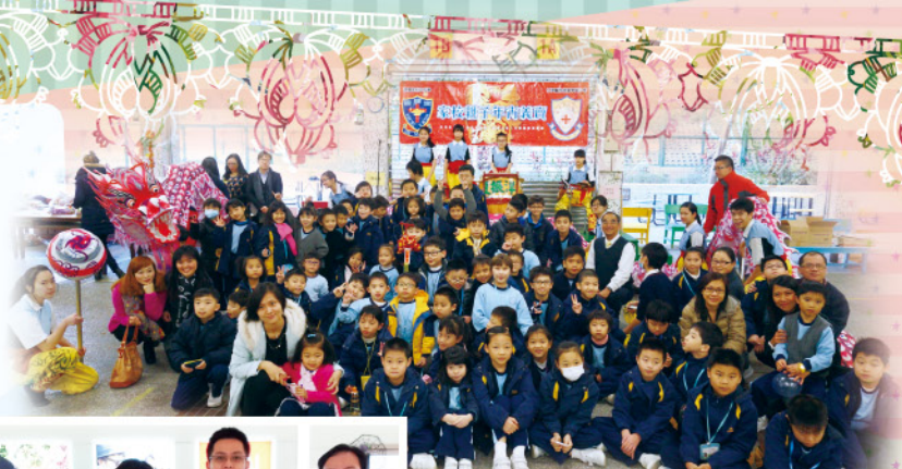
怡文中學的舞龍隊到校表演暨 年宵義賣

仁濟醫院為本港知名慈善團體，服務社會不遺餘力。本校為仁濟醫院屬下其中一所津貼小學，貫徹「尊仁濟世」精神，提供優質全人教育，培育學生成為國家棟樑，故亦讓學生與家長透過參與不同的慈善公益活動，體會「施比受更有福」的精神，幫助有需要的人，並回饋社會。