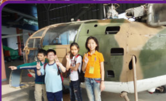
參觀空軍博物館，大家都十分興奮