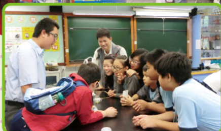
參加「創新科技發明 工作坊」，探究新科技