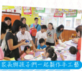
家長與孩子們一起製作手工藝

本校於9月14日舉行了「視藝同樂展繽紛2013暨校園開放日」，讓趙校同學與區內幼稚園同學、家長以視藝交流，並開放校園讓來賓參觀，增加對學校的認識。當天非常熱鬧，除本校學生積極參與外，約有二百多位幼兒學生及家長參加。而本校的家長教師會亦鼎力協助，為我們提供食物與飲品。整個活動在歡樂的氣氛中完成，大家都期望在明年的活動中再相逢。