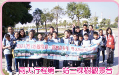
兩天行程第一站三棵樹觀景台