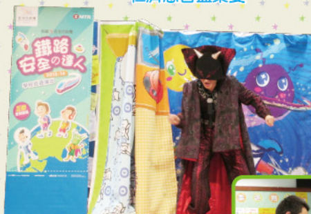
港鐵x香港話劇團 《鐵路安全的達人》 到趙校演出