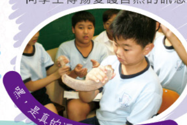
嘿，是真的河馬牙，幸而沒咬我