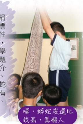
嘩，蟒蛇皮還比我高，真嚇人