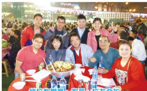
趙校教職員、家長、校友參加 仁濟慈善盆菜宴