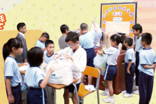
看，這就是回收膠樽的熱鬧場景

本校第二屆回收膠樽變資源班際比賽又再展開，在10月16日至10月25日期間舉行。目的在教育學生具有環保的觀念，使孩子們理解分類回收是由家庭做起，並培養珍惜地球資源的習慣，成為一個綠色環保人。