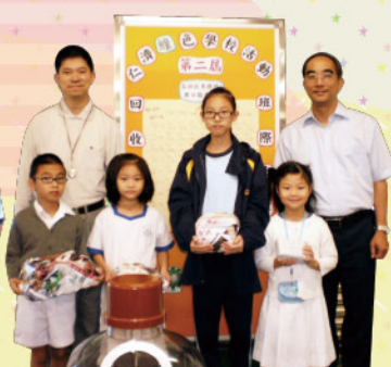
積極的班級獲得嘉獎