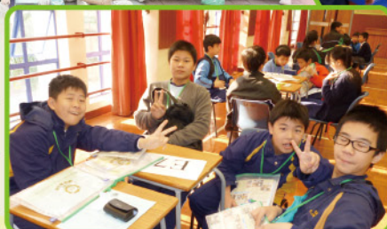
「狗教授」又蒞臨趙校 教同學們英文了