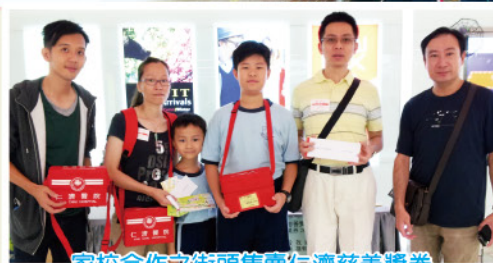
家校合作之街頭售賣仁濟慈善獎券