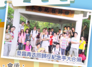
登臨青衣回歸紀念亭大合照

蟬鳴荔熟秋將至，荏苒時光又一年。一年一度的校友會會員大會在七月六日下午於本校一樓禮堂舉行。老師、校友歡聚一堂，閒話舊時年，並商議會務發展。會後，喜雨忽臨把人留，大夥兒有的打乒乓球，有的玩紙牌、電子保齡球……雨停了，便起步沿青衣回歸徑登上位處山巔的回歸紀念亭，遠眺青山、白雲、碧海、藍天，雖美景醉人，但剎那間已是紅霞滿天邊，是踏上歸途晚宴的時候了。晚宴上觥籌交錯，是日暢叙在一片歡笑聲中結束。