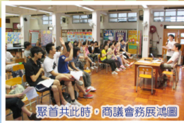
聚首共此時，商議會務展鴻圖