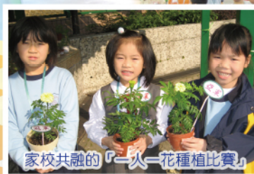
家校共融的「一人一花種植比賽」