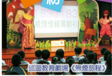
巡迴教育劇場《無煙旅程》