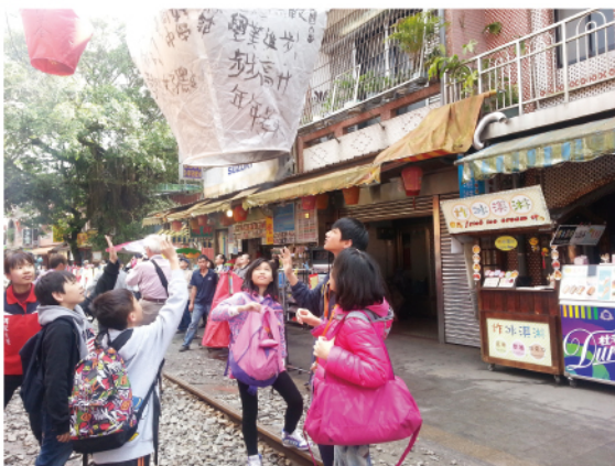
盛載心願的孔明燈飛向天空