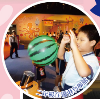
二年級在香港科學館