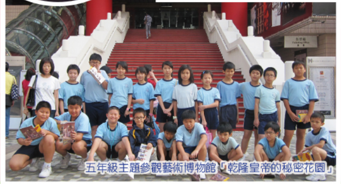
五年級主題參觀藝術博物館「乾隆皇帝的秘密花園」