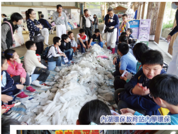
內湖環保教育站內學環保

2013年3月22至25日，本校師生遠赴台灣，除參觀學習台灣的風俗文化及環保建設外，亦瀏覽了寶島的美麗風光，為小學階段的學習生活留下一個美麗的回憶！