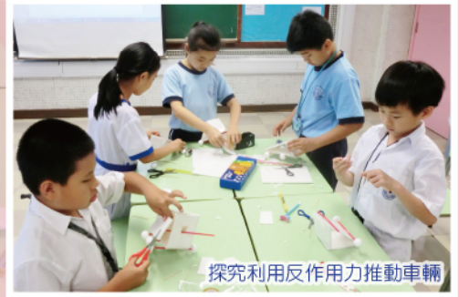
探究利用反作用力推動車輛