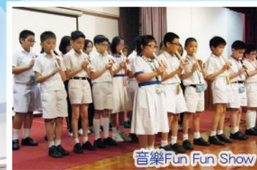
音樂Fun Fun Show