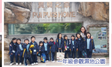
一年級參觀濕地公園