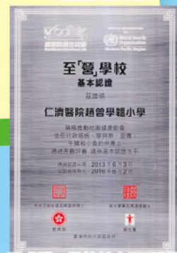
至「營」學校基本認證獎牌