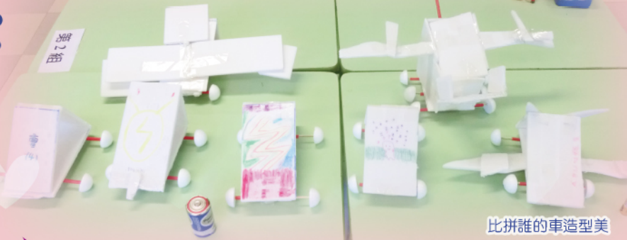
比拼誰的車造型美

在炎炎夏日的一個六月天，本校舉行「常識科技日」，全校學生一起探究科學原理，進而把所學的理论應用在創新產品上，改善日常生活的素質。所謂「萬丈高樓從地起」，要有科技的觸覺，最理想便是從孩童時代開始培養對科學探究的興趣。因此，舉辦這項活動便深具意義了。