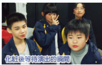
化妝後等待演出的瞬間

本校四至六年級英語話劇組同學經過了接近半年的時間，每週由經驗豐富的小莎翁導師到校，為同學們進行英語話劇訓練。為了讓同學有機會實踐所學，2013年3月23日(星期六)，英國文化協會假座柴灣青年廣場Y綜藝館，舉辦一場大型的話劇表演。同學們的精湛演技，贏得了全場的掌聲。本校學生在整個訓練過程當中，除獲取了難得的舞臺經驗外，亦砥礪了英語的能力。